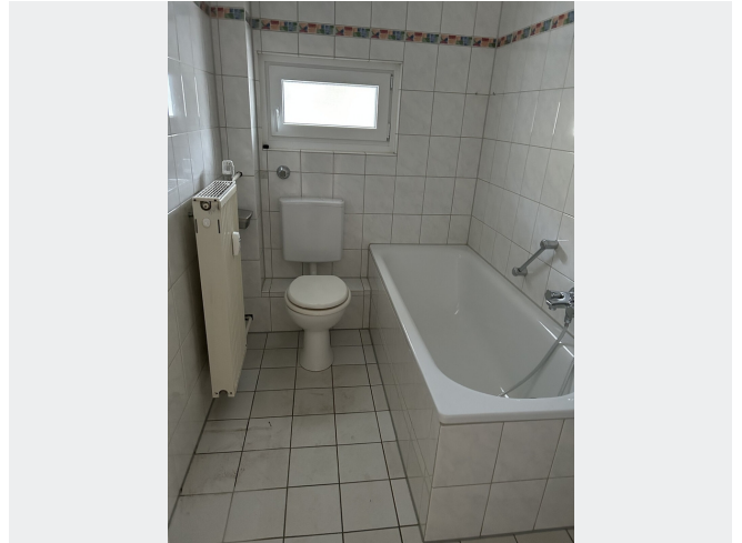
Bad mit Wanne