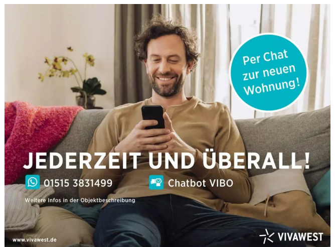
Kontakt per Messenger!