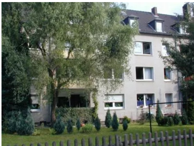
Kampstr. 20 Hofseite