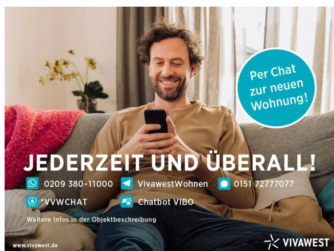
Bild Messenger Internetanzeige