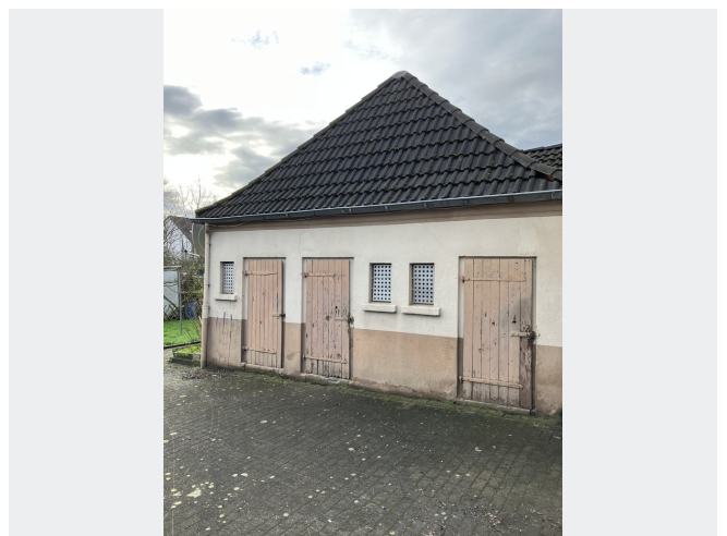
Abstellraum hinter dem Haus