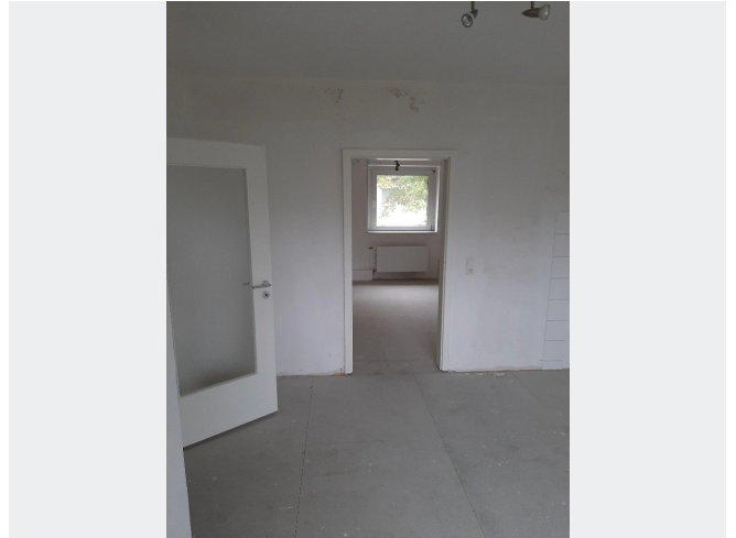
Küche als Durchgangszimmer