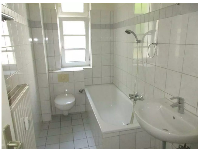
Badezimmer Bild 1