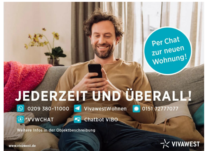
Kontakt per Messenger!