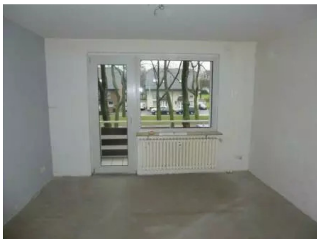
WZ Zugang Balkon