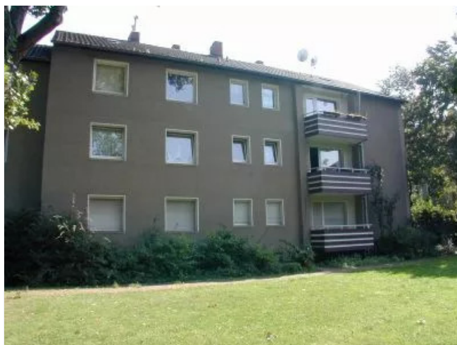
Nombericher Platz 16