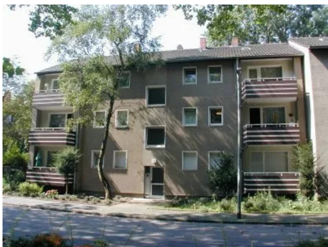
Nombericher Platz 16