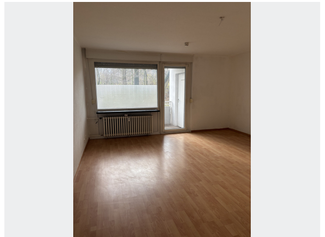
Wohn- und Schlafraum