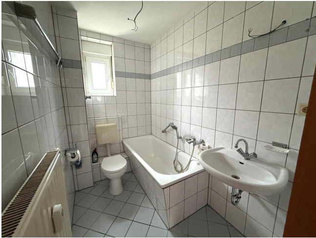
Badezimmer mit Fenster