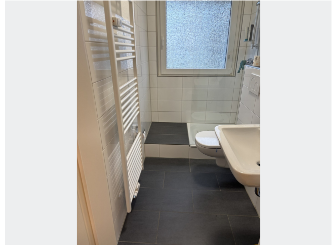
Duschbad mit Glasabtrennung