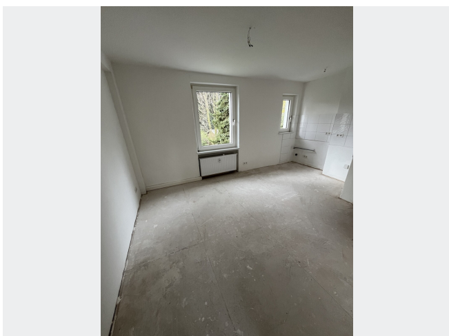
Wohnen / Küche