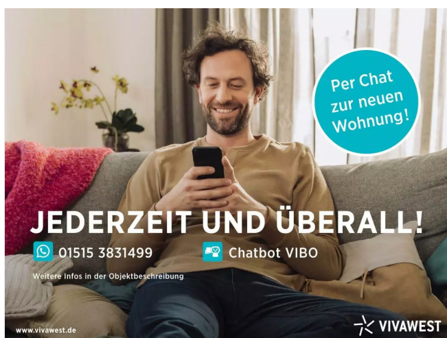
Kontakt per Messenger!