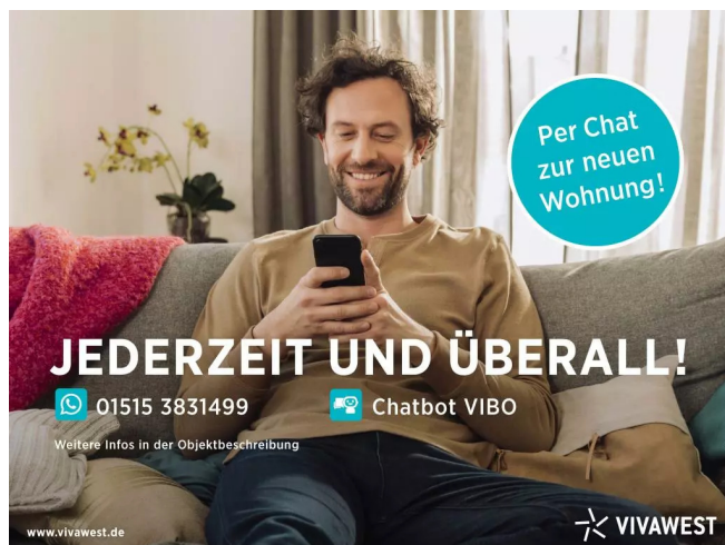
Kontakt per Messenger!