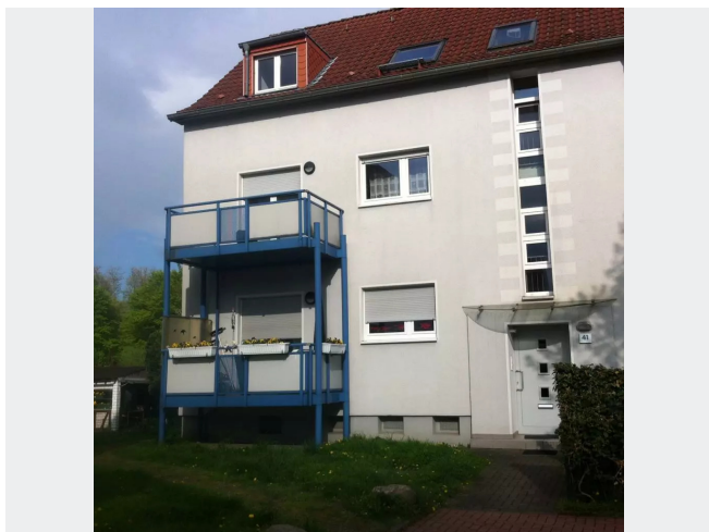
Am Lakenbruch 41