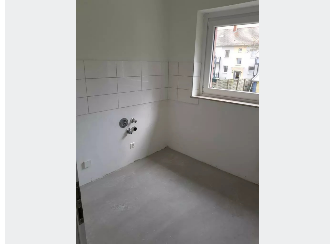
Küche m.weißem Fliesenspiegel