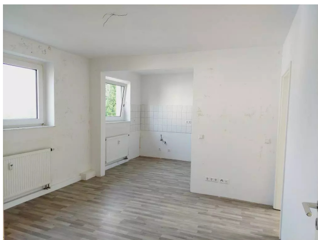
Wohnbereich mit offener Küche