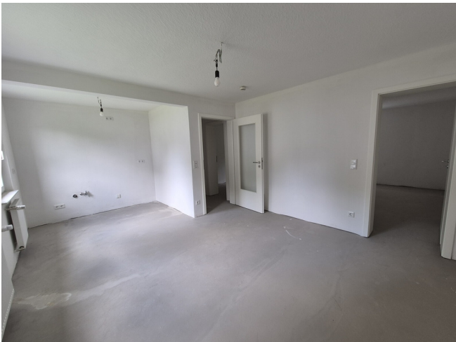
Wohnküche - Muster