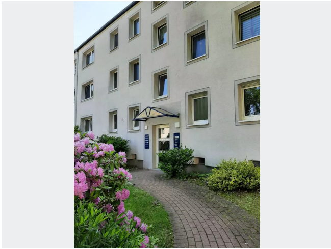
Hausansicht - Muster