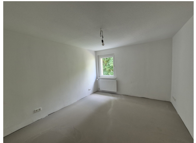
Schlafzimmer - Muster