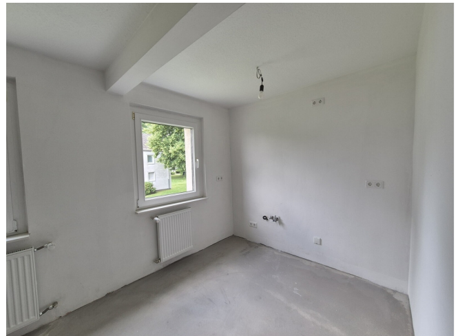
Küche - Muster