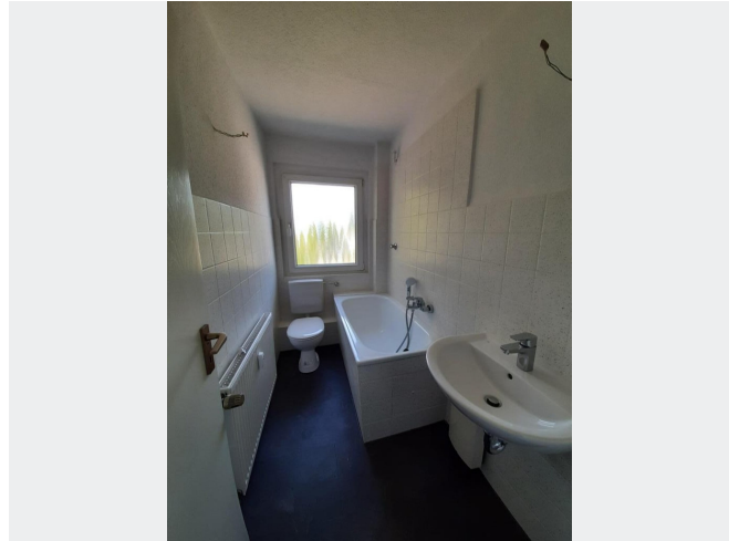
Bad - Muster