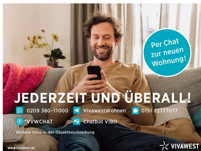
Kontakt per Messenger!