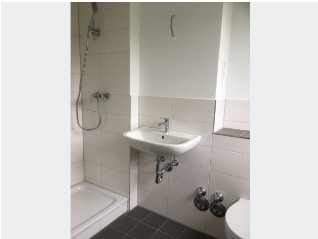
Duschbad mit Fenster