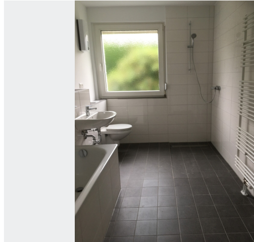
Wannenbad mit Fenster