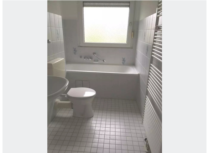
Wannenbad mit Fenster