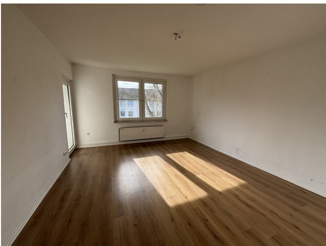
Wohnzimmer - Muster