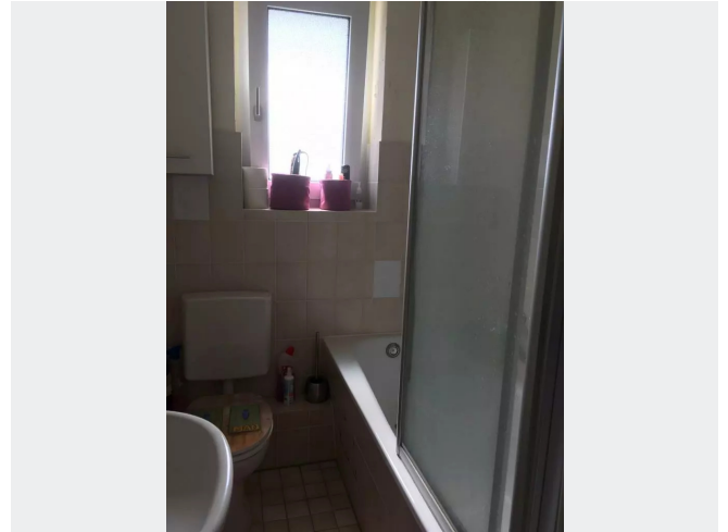
Wannenbad mit Fenster