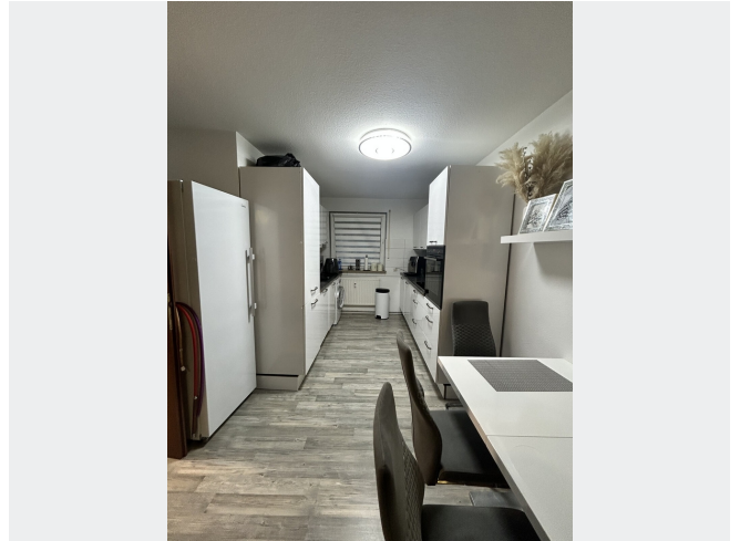
Küche m. Essbereich