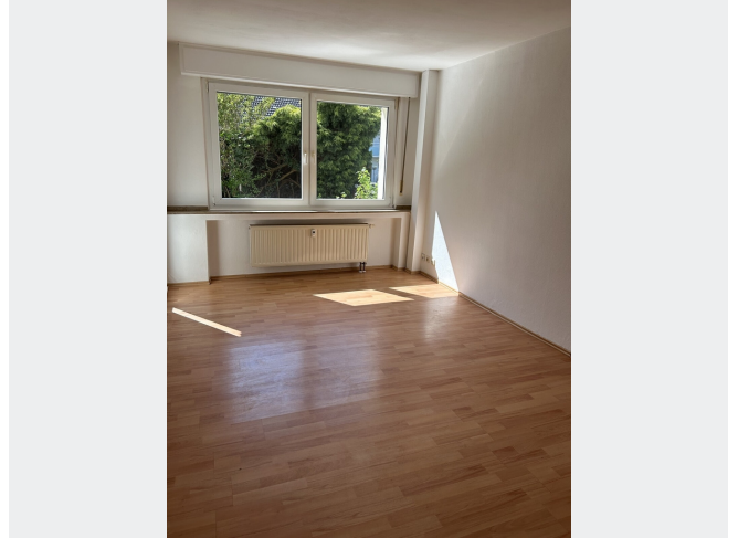
Wohnzimmer erste Ansicht