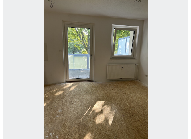
Wohnküche nach Modernisierung