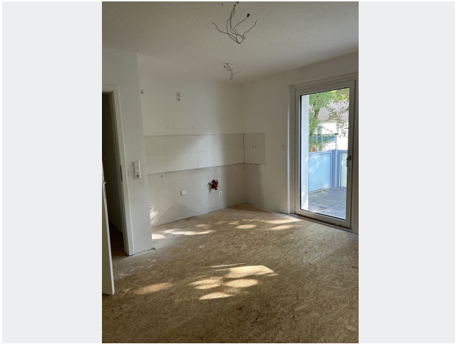
Wohnküche nach Modernisierung