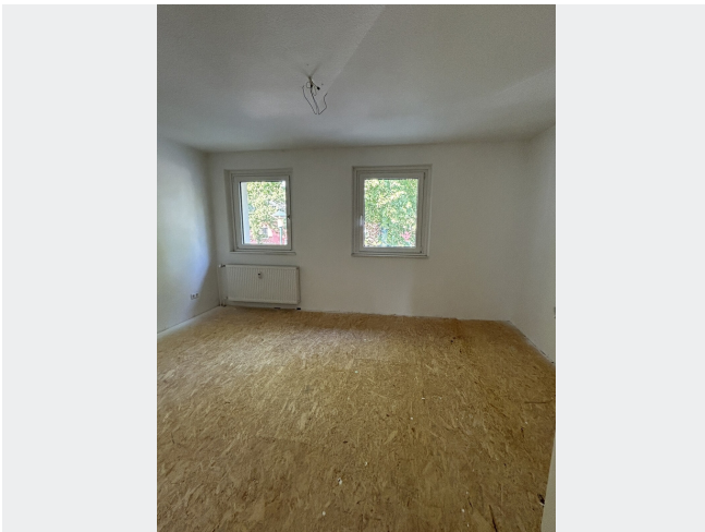
Schlafzimmer nach Modernisierung