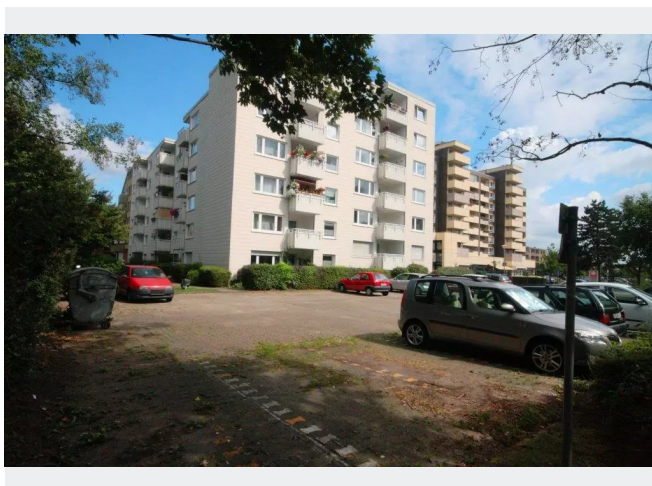
Stellplätze am Haus