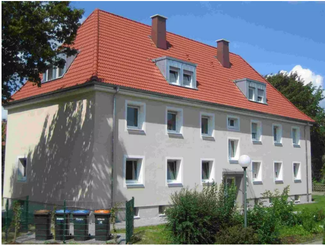
Sumpstrecke 47 - Strassenansic