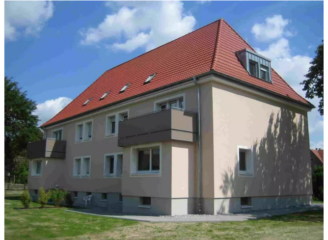
Sumpstrecke 47 - Rückansicht