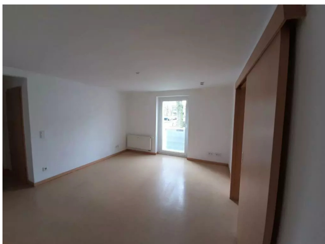
Wohnzimmer Ansicht 2