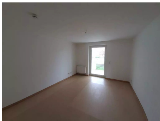
Schlafzimmer Ansicht 1