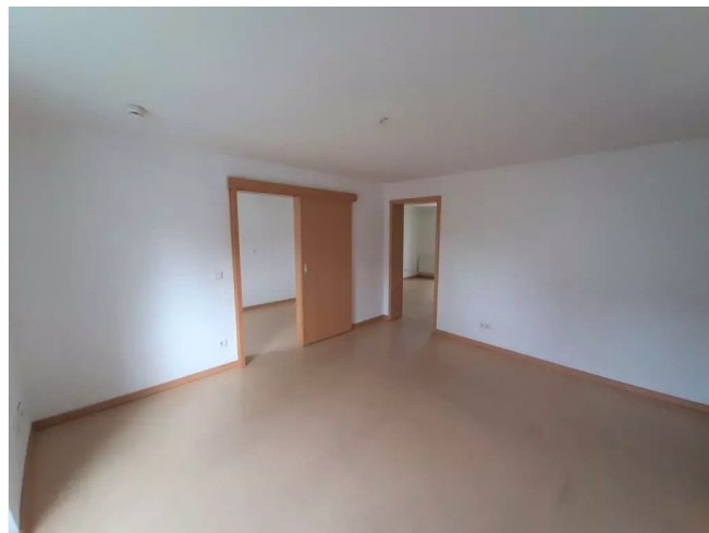
Wohnzimmer Ansicht 1