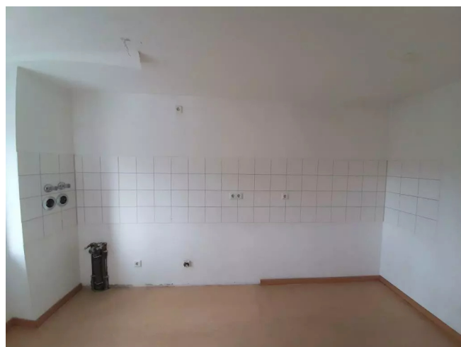
Küche Ansicht 2