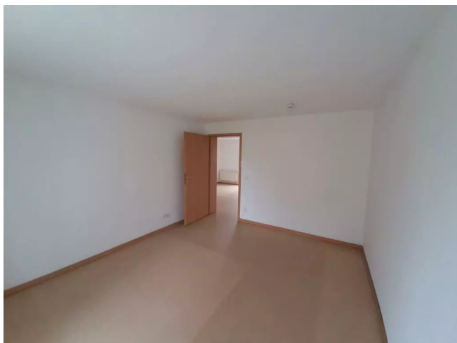
Schlafzimmer Ansicht 2