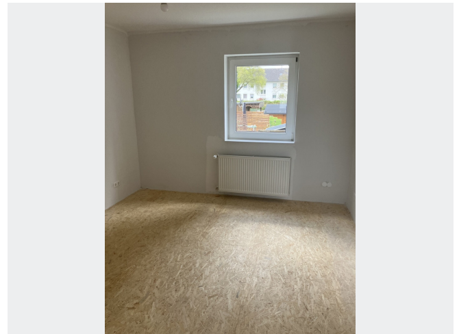
Schlafzimmer - Muster