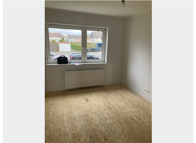
Wohnzimmer - Muster