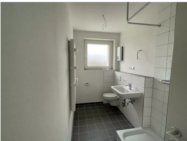
Tageslichtbad mit Dusche