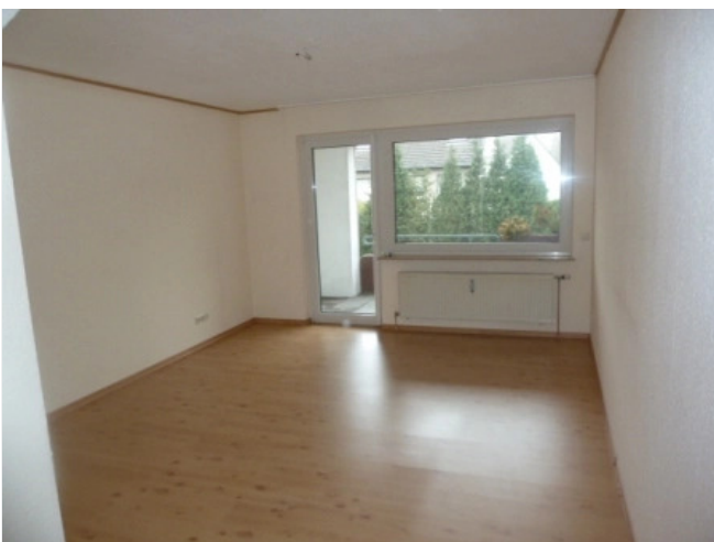
Wohnzimmer Beispiel Bild