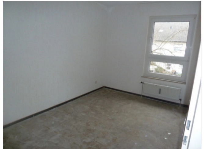
Schlafzimmer Beispiel Bild