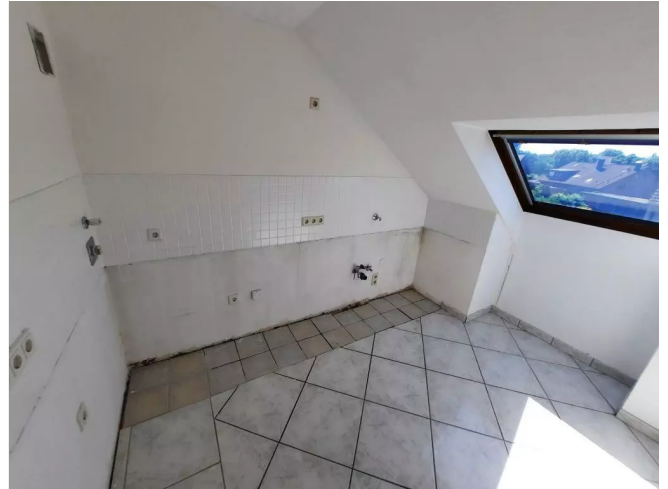
Küche Beispiel Bild