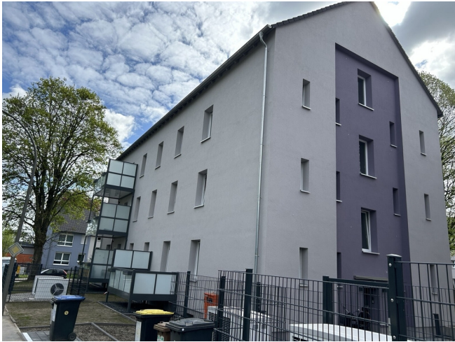
Menglinghauser Str. 50