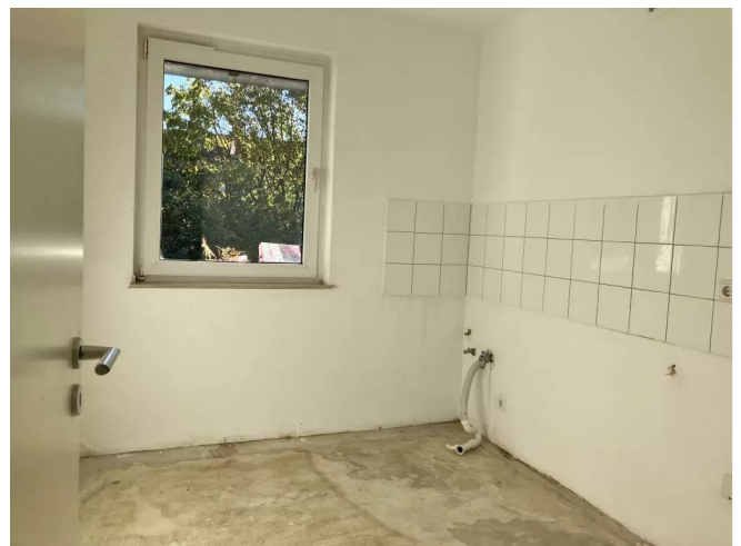
Küche Beispiel Bild