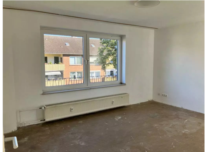
Wohnzimmer Beispiel Bild