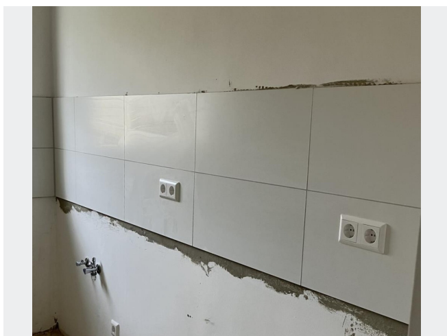
Fliesenspiegel Küche (Muster)