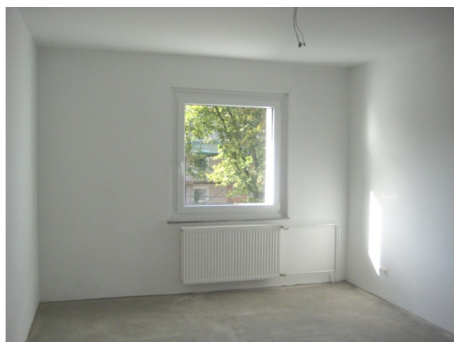
Kinderzimmer - Beispiel