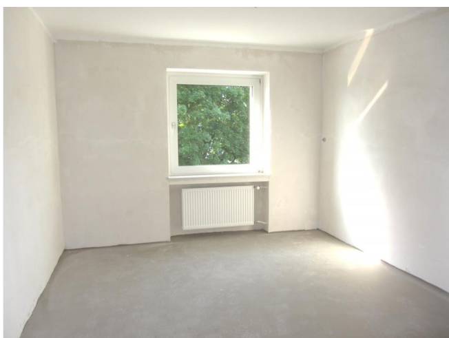
Schlafzimmer - Beispiel