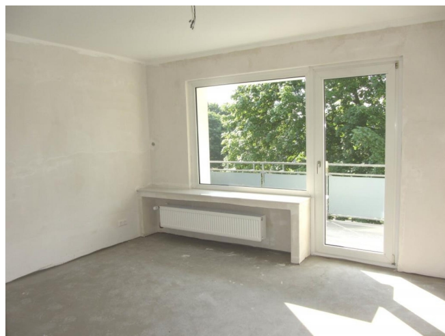
Wohnzimmer - Beispiel