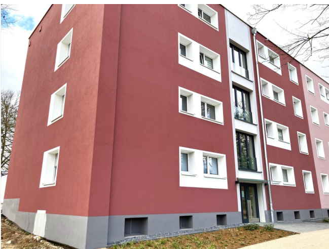
Hausansicht nach MOD