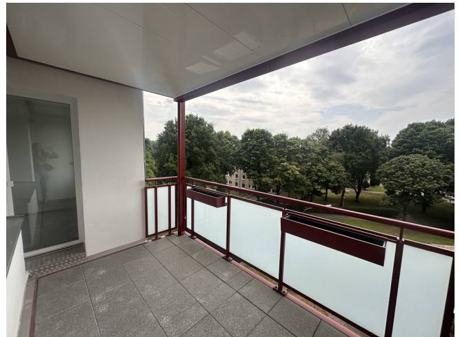
Balkon (Beispiel, hinter)