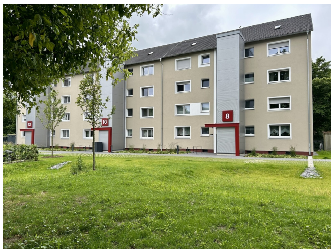
Am Timpenkotten 8-12