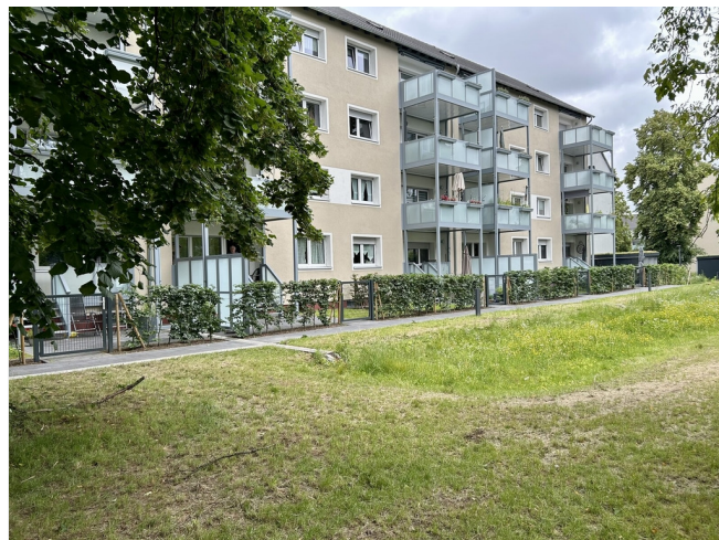
Am Timpenkotten 8-12